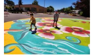
West Salem neighborhood street mural project.